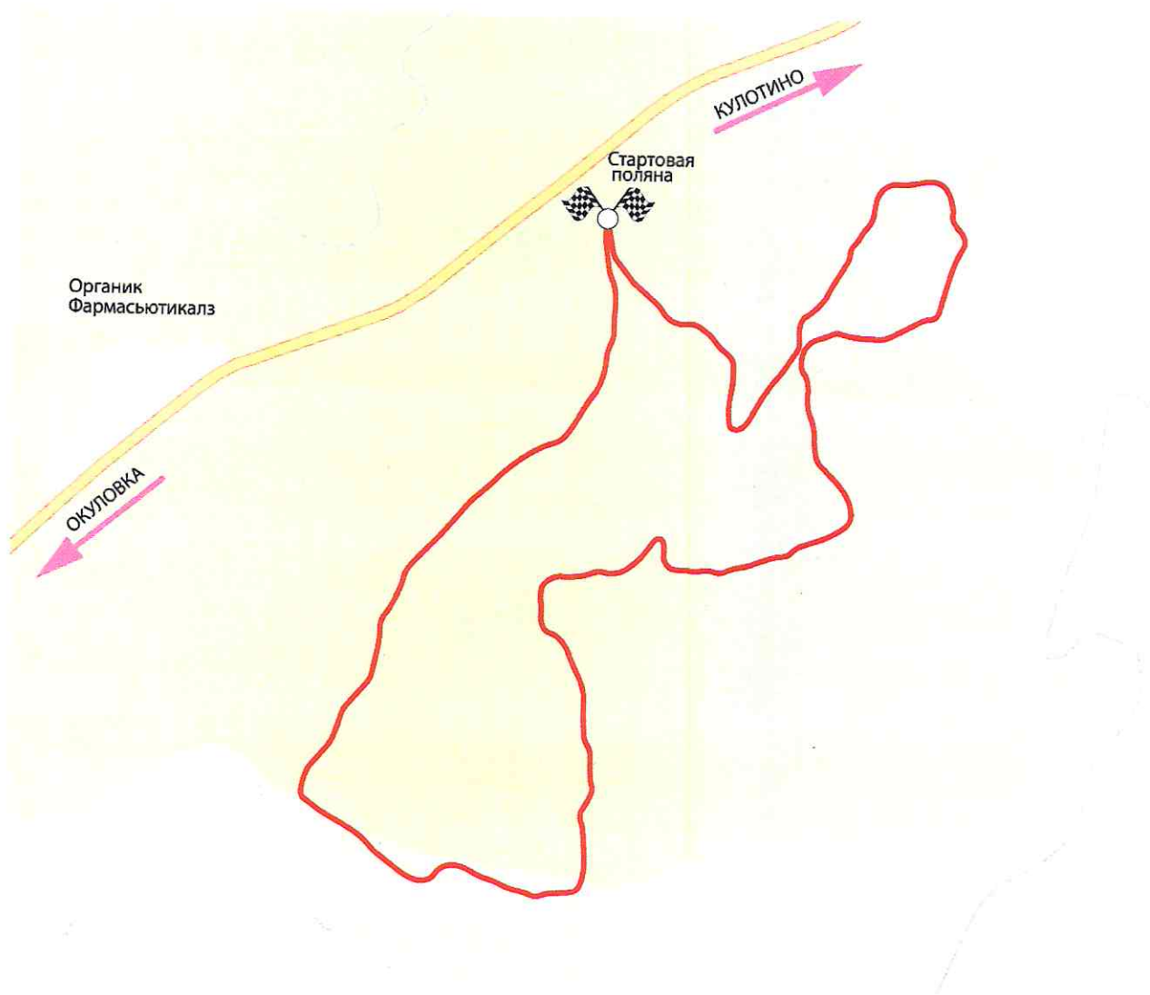
Схема основных дистанций

5,275 КМ. = 1 КРУГ 10,55 КМ. = 2 КРУГА 21,1 КМ. = 4 КРУГА