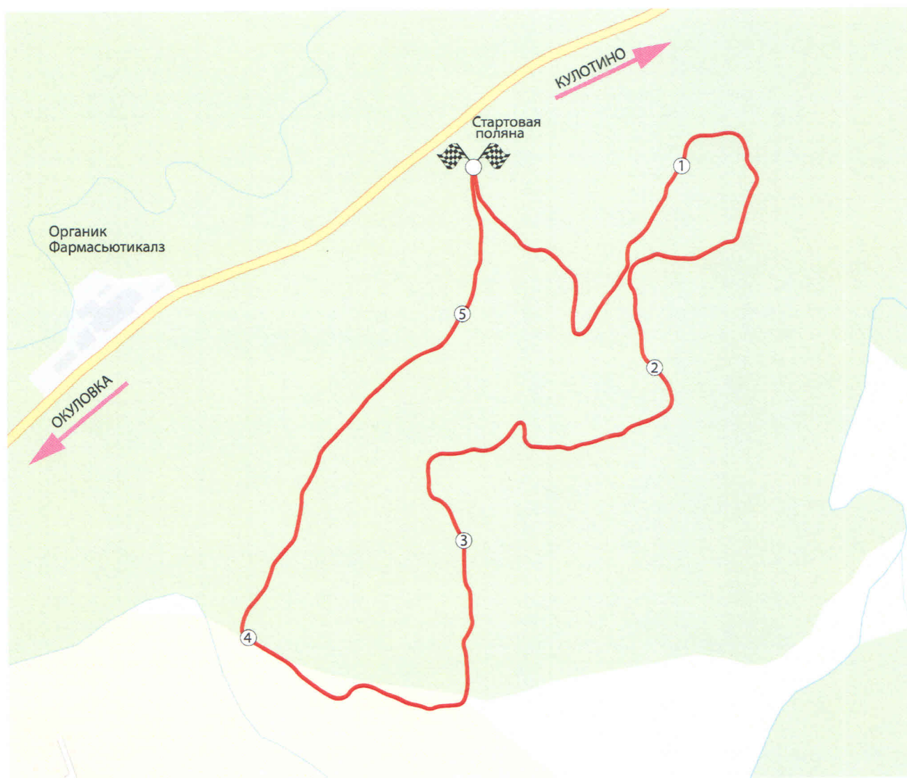
Схема основных дистанций

5,275 KM. = 1 КРУГ 10,55 KM. = 2 КРУГА 21,1 KM. = 4 КРУГА